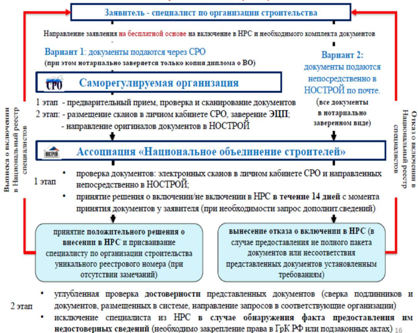
Схема действий по ведению Национального реестра специалистов в области строительства (НРС)